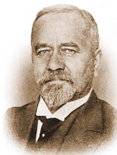
Figure 6. Albert Calmette (1863-1933)

À bord, de nombreuses punitions sont infligées pour « ivresse à terre », confortant le sentiment de Calmette lorsqu'il écrit que dans ce pays sévit la « gabonite », un curieux amollissement dû à une atmosphère humide et étouffante qui enlève à beaucoup d'Européens