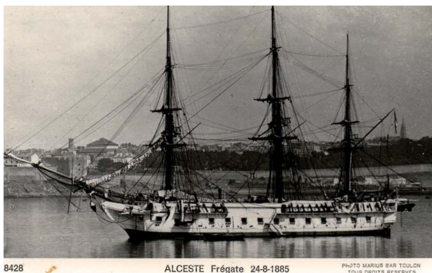
Figure 4. La frégate l'Alceste en 1885