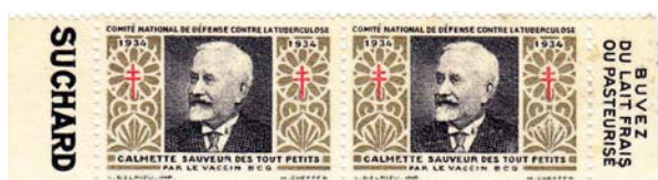
Figure 5. Timbre poste du Comité national de défense contre la tuberculose : Calmette sauveur des tout petits par le vaccin BCG (1934).

La station locale du Golfe de Guinée se compose en 1886 de nombreux bâtiments : l'avis transport Pourvoyeur , les avisos de 2 e classe et de 3 e classe Mésange , Laprade et Basilic , les chaloupes à vapeur Pygmée , Rubis et Turquoise (annexes de l' Alceste ) ainsi que Saphir , la citerne à vapeur Como , le cutter colonial Courrier assurant le service postal entre le Gabon et Sao Tomé et celui du service de la douane, le Surveillant . Et enfin l' Alceste , navire-ponton utilisé comme navire-hôpital.