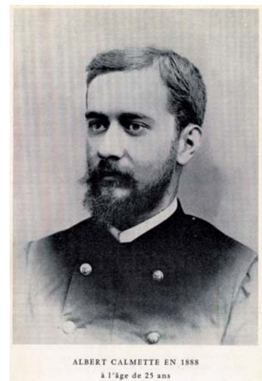
Figure 1. Albert Calmette en 1888